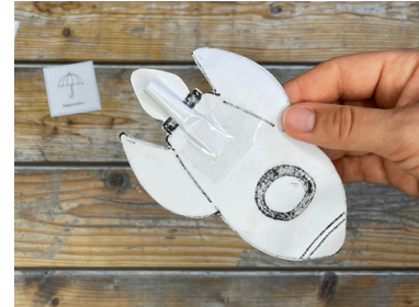
Rückseite der Rakete mit aufgeklebter Papierrolle

Dein Kind kann jetzt die Rakete mit der Papierrolle auf den Trinkhalm schieben und in den Trinkhalm pusten. Schon saust die Rakete los! Dabei wird spielerisch die Mundmotorik trainiert.